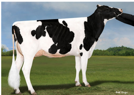
SYNERGY RUBICON PERFECT THIRD DAM